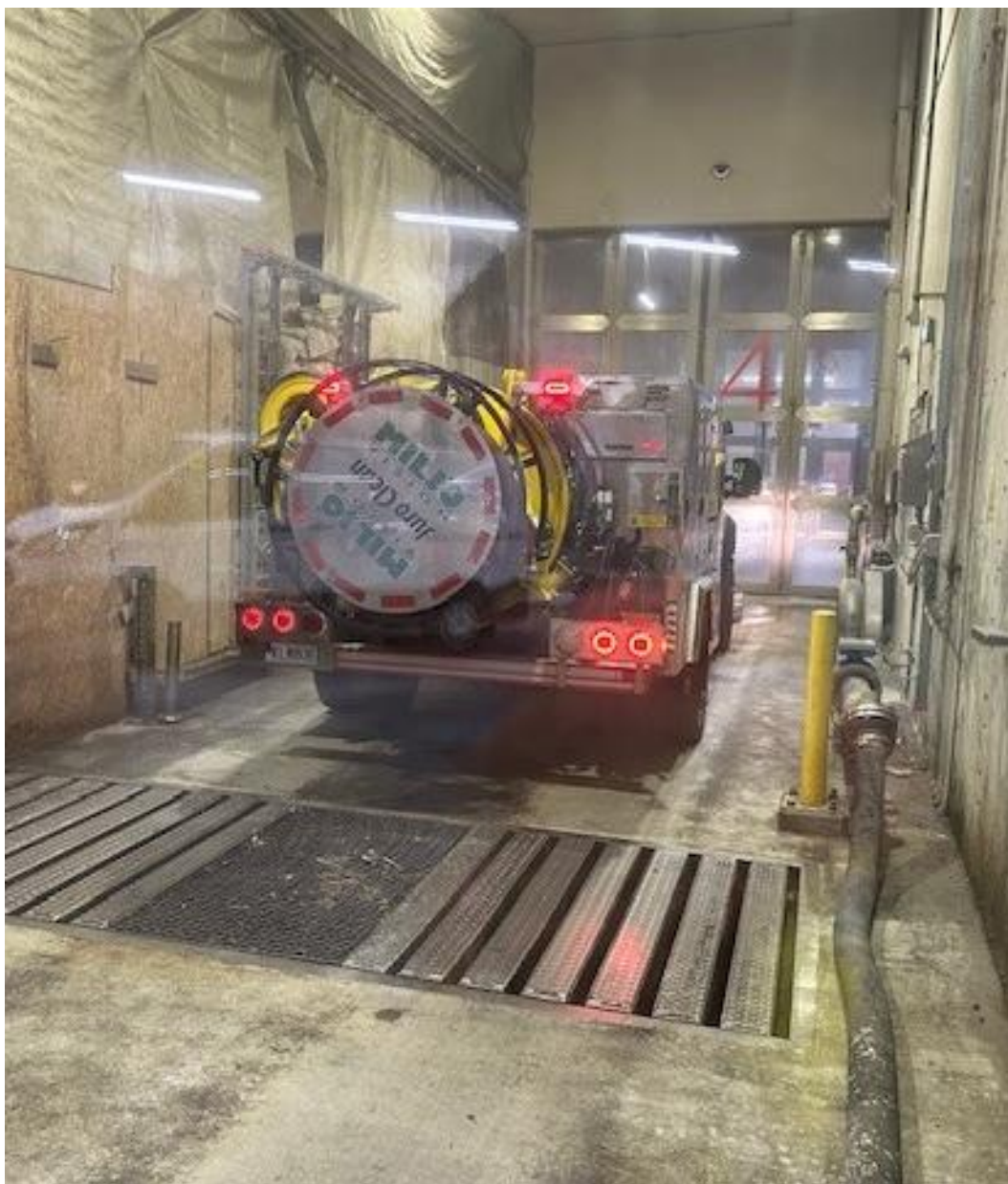
Bild från mottagningsstationen för organiskt material på Henriksdals reningsverk