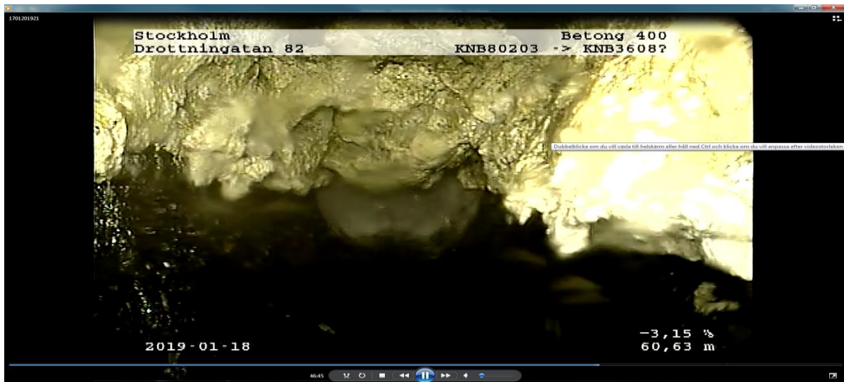
Fettavlagringar i avloppsledning i Drottninggatan, Stockholm

Fett är i de flesta storstäder i världen den vanligaste orsaken till avloppsstopp och kostar stora summor och resurser att hantera. Att på olika sätt minska mängden fett i ledningsnätet är en central fråga för VA-huvudmän och fettavskiljare har visat sig vara en effektiv och robust metod. De första fettavskiljarna togs i bruk på 1880-talet, så det är ingen ny uppfinning. I Stockholm tog det fart med installationer av fettavskiljare i mitten av 1990-talet. På den tiden hade bolaget ca 1500 fettrelaterade avloppsstopp per år. I dagsläget finns det ca 4 000 fettavskiljare i SVOA:s verksamhetsområde och de fettrelaterade avloppsstoppen har minskat med ca 95 %.